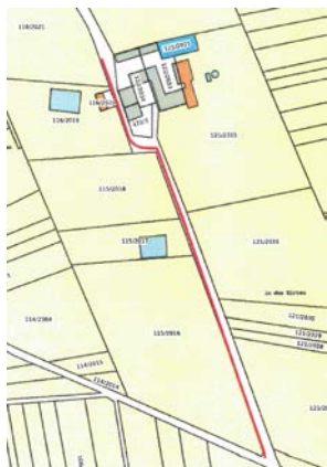
Auf dem Birkelt

Der Kostenvoranschlag wird einstimmig angenommen. Das Landwirtschaftsministerium subventioniert die Arbeiten mit