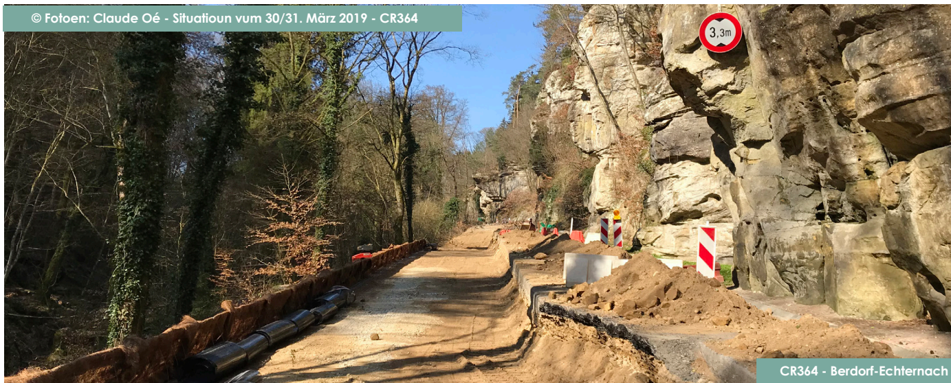
Situatioun vum 30/31. März 2019 - CR364